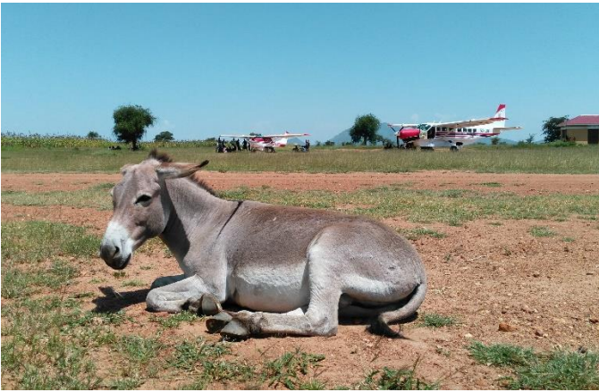
Ezels op de landingsbaan...