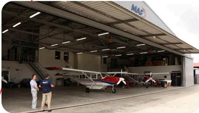
Vliegveld Zorg en Hoop in Suriname