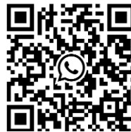
van Bergeijk op missie WhatsApp-kanaal

Op Instagram en WhatsApp hopen we de komende periode regelmatig wat te delen over ons traject. Door de QR-codes te scannen kunt u ons hier gaan volgen.