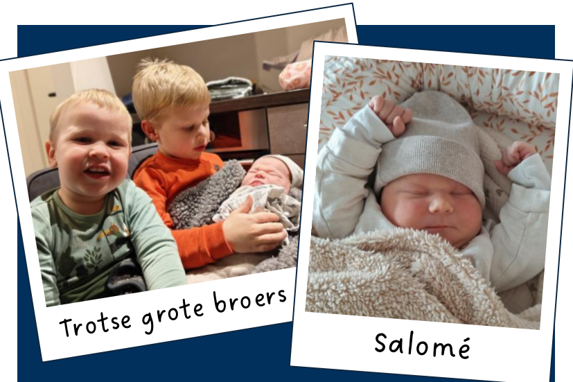
Trotse grote broers

We zijn dankbaar dat ons ThuisFrontTeam (TFT) bijna compleet is. De laatste open plek is hopelijk snel gevuld. Inmiddels zijn we van start gegaan met de eerste kennismaking en vergadering. Binnenkort staat een verdere kennismaking met elkaar en een bezoek aan het kantoor van MAF in Teuge gepland. In de komende nieuwsbrieven zullen de TFT-leden zichzelf kort introduceren zodat u ook weet welke gezichten er achter onze uitzending staan. Neemt u ook deze belangrijke taken mee in het gebed? Zonder hun werk kunnen wij als gezin niet uitgezonden worden.