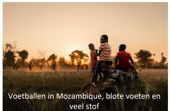
Voetballen in Mozambique, blote voeten en veel stof