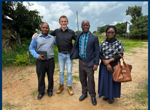
Met de pastor van een lokale kerk op de foto. Het kostte mij in totaal 4 uur per voet om deze dienst bij te wonen.