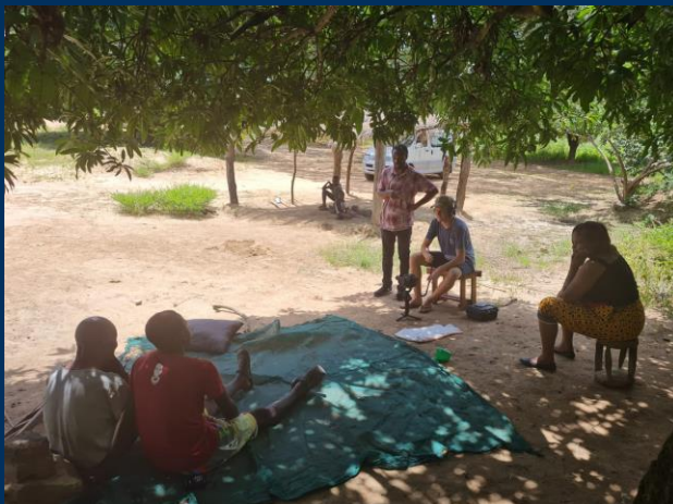
Een interview onder de boom.