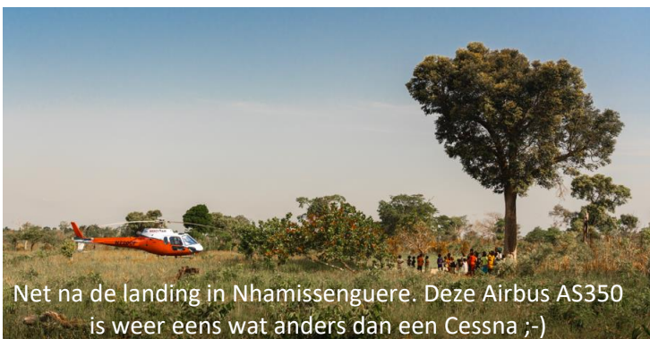
Net na de landing in Nhamissenguere. Deze Airbus AS350 is weer eens wat anders dan een Cessna ;-)

De weken hierna ben ik als vrijwilliger werkzaam geweest bij de thuisbasis van Mercy Air in Witrivier. Een prachtige omgeving waar ik veel van Gods schepping heb kunnen zien. Bijgaand wat foto's: