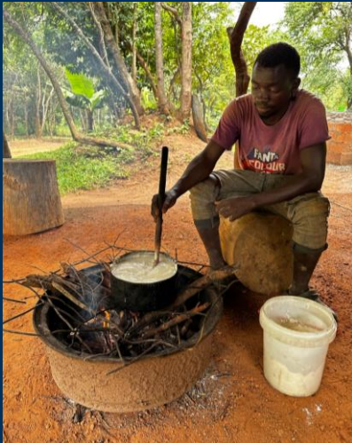
Nshima (maismeel) eten met locals. De pan heeft geen steel, gewoon met blote handen van het vuur afhalen!