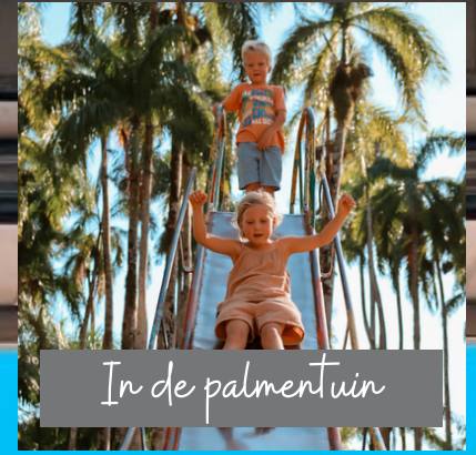
In de palmentuin

Suriname ligt iets ten noorden van de evenaar. De hoofdstad is Paramaribo. Suriname heeft een warm en vochtig tropisch klimaat.