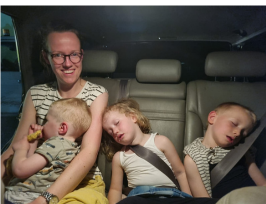
Midden in de nacht komen we aan bij ons nieuwe huis. Na een hele lange dag konden de kinderen de ogen toch niet meer openhouden.