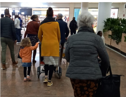
Met z'n allen op de luchthaven in Brussel.