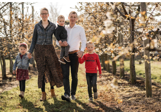
Nog een Betuwse fotoshoot voor vertrek.