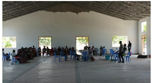
Alle moeders die geduldig op hun beurt met de dokter wachten.