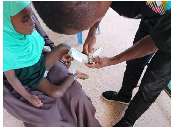
Het voetje van dit kindje wordt langzamerhand weer rechtgezet.