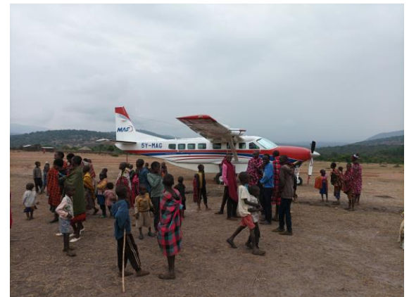
Bij de Masai op bezoek. Een weekend samen met een veearts op stap om de Masai te helpen met de problemen die zij met hun vee hebben.