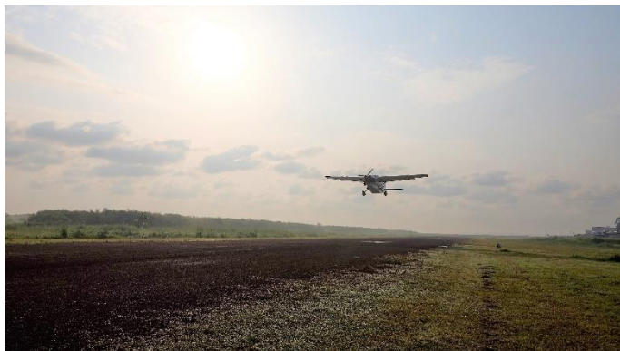
Rembrand vertrekt in 5X-MAE vanaf Kajjansi, bestemming Kenia

Er wordt bij MAF nagedacht over hoe de regio Oost-Afrika wat meer als één geheel aangestuurd kan worden, in plaats van als losse puzzelstukjes te functioneren. Ik had het bijzondere voorrecht om onlangs al een voorproefje te hebben: ik maakte vluchten van en naar Kenia, Tanzania en Zuid-Soedan en binnen Oeganda. Allemaal binnen 1 week tijd.