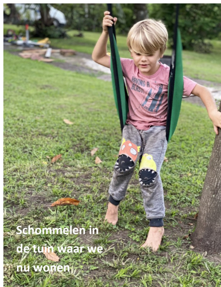
Schommelen in de tuin waar we nu wonen