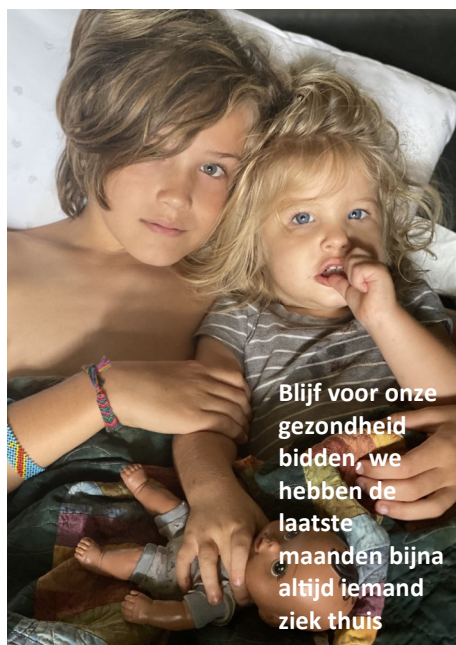
Blijf voor onze gezondheid bidden, we hebben de laatste maanden bijna altijd iemand ziek thuis