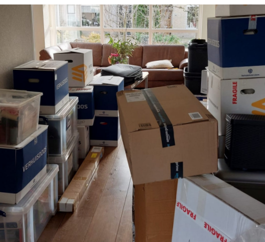
Het huis vol dozen... Dan wordt de container volgeladen...