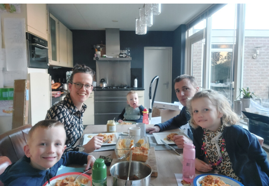
De laatste maaltijd in ons huis in Deil. Zuurkoolstampot met rookworst!