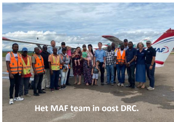
Het MAF team in oost DRC.

De DRC is een land dat vroeger Zaïre heette. Tot 1960 was het een Belgische kolonie en om die reden is het Frans de officiële taal. Het is een enorm uitgestrekt land (een derde van de VS) en bevat het op één na grootste regenwoud ter wereld. MAF heeft twee vliegprogramma's in dit land. Eén programma in west DRC wat aangestuurd wordt vanuit de hoofdstad Kinshasa (derde grootste stad in Afrika!) en één programma in oost DRC dat op dit moment aangestuurd wordt vanuit Bunia.