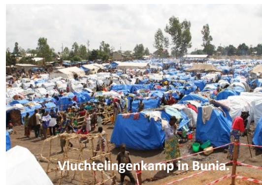
Vluchtelingenkamp in Bunia.

“Twee jaar geleden was de MAF basis nog in Nyankunde. Toen daar de FPIC militia gevormd werd en begon te vechten, hebben we na drie dagen besloten naar Bunia te evacueren in het noordwesten. Sinds die tijd rukt de CODECO militia op vanuit het noordoosten, de ADF in het zuidoosten en de FRPI vanuit het zuiden. We zijn niet de enigen die naar Bunia geëvacueerd zijn. In de regio ontstonden tien vluchtelingenkampen en in totaal zijn er zo'n vijf miljoen mensen op de vlucht binnen de DRC. Voor de gezinnen van ons team konden we een aantal huizen in Bunia huren en een gebouwtje dat dient als 'kantoor'. Er moesten nieuwe lokale medewerkers gezocht worden en dagelijks komen inmiddels meer dan honderd mensen met vluchtaanvragen langs op het kantoor. Op het vliegveld van Bunia kon wat ruimte worden bemachtigd om de drie Cessna Caravans en de kleinere Cessna 206 te parkeren. Ze staan daar ingeklemd tussen de helikopters van het Congolese leger aan de ene kant en de VN vliegtuigen en helikopters aan de andere kant.”