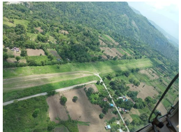
Eén van de vele vliegveldjes in Oost-Timor.