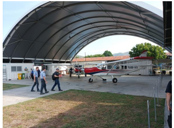
De hangaar in Dili (Oost-Timor) met twee GA8 toestellen.

Veel van de vluchten in Arnhemland gaan over zee. Je vliegt over ongerepte stranden, duinen en bossen. Het is een heel mooi gebied en het is aanlokkelijk om er te gaan zwemmen, behalve dat het er vol zit met krokodillen.