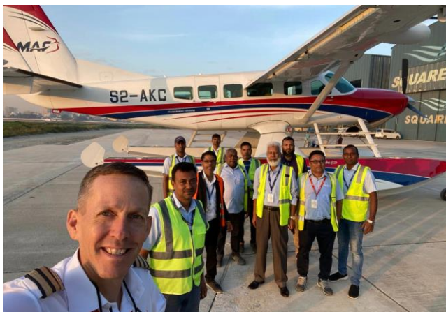
Het team in Bangladesh net voordat het laatste vliegtuig vertrok.

MAF is sinds begin jaren '80 actief in Bangladesh. De afgelopen jaren werd het werk voor dit programma echter steeds minder. Daarom is besloten om ons hier als MAF terug te trekken. In de afgelopen maanden ben ik betrokken geweest bij het sluiten van dit bijzondere programma. De twee amfibische vliegtuigen (vliegtuigen die zowel op het land als op het water kunnen landen en opstijgen) die we hadden in Bangladesh zijn in november naar onze onderhoudsbasis in Australië gevlogen. Dit is een van de dingen die ik nu organiseer in mijn nieuwe rol.