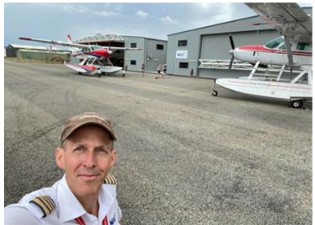
De twee amfibische Cessna Caravans voor de hangaar in Mareeba (Oost-Australië).