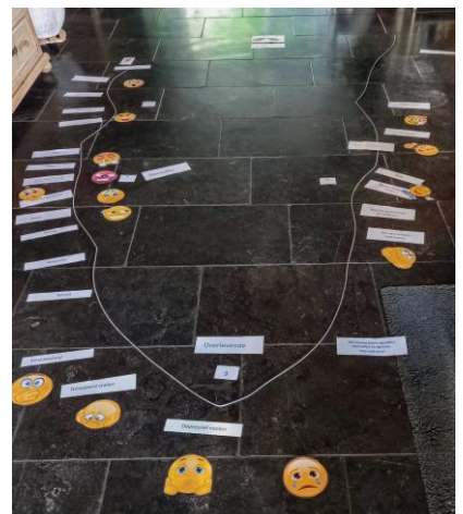
Het verwerken van de theorie tijdens de 'debriefing'.