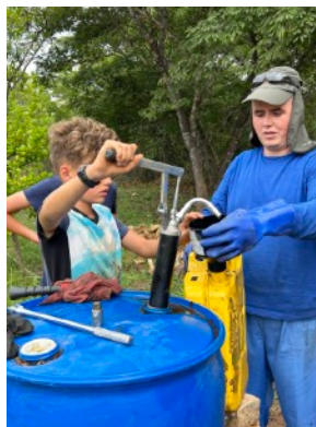
Vele handen maken licht werk - bulldozer onderhoud