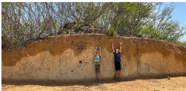
Eén van de 14 termieten heuvels die 'in de weg' lagen van de vliegstrip

Het werk wordt gedaan door vrijwilligers vanuit Canada. Bid u mee dat als de strip klaar is we er snel gebruik van mogen maken?