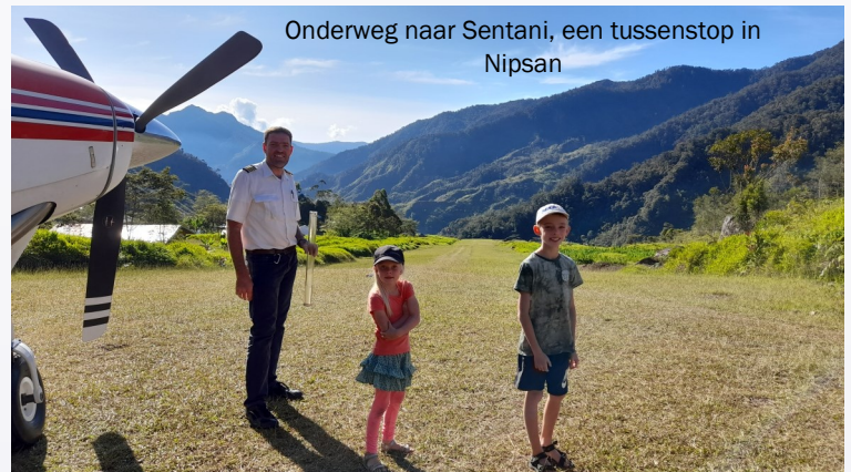
Onderweg naar Sentani, een tussenstop in Nipsan