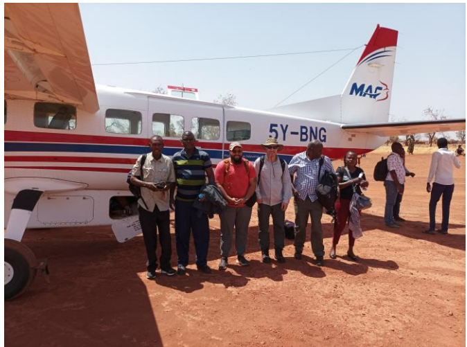
Teams komen om mensen in afgelegen dorpen te helpen.