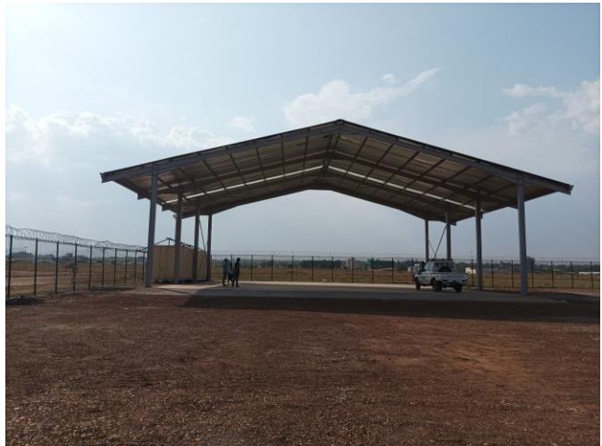
De hangar in Juba.

Bovenstaande foto illustreert mooi dat we door de mist in het leven niet altijd goed vooruit kunnen kijken en dat we niet altijd kunnen weten wat er gaat gebeuren, ook al probeer je het zo goed mogelijk te plannen. Maar toch mag je zo af en toe door de mist heen naar voren kijken en erop vertrouwen dat er een grotere wereld achter zit.