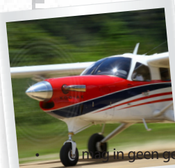
U bent in geen geval op het vliegveld