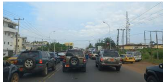
In de spits worden er aan alle kanten 'rijbanen' toegevoegd

Vaak krijgen we de vraag of we al gesetteld zijn. Dat blijft altijd een lastige vraag om te beantwoorden. Ja, we voelen ons gesetteld in het team, we kunnen de weg in de stad naar verschillende winkels vinden. Zelfs het verkeer begint al een beetje te wennen. (We waren best al wel aan het chaotische verkeer hier gewend, maar het verkeer is hier echt nóg chaotischer dan in de vorige landen.)