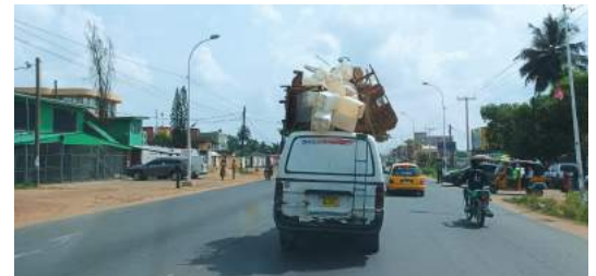
Je ziet van alles onderweg

Goed settelen vraagt echter veel meer tijd. Dit betekent o.a. het opbouwen van relaties, het vinden van een fijne kerk en het thuis voelen op je plek. Onze spullen zijn nog steeds onderweg. We gebruiken nu spullen van de zogenaamde MAF-kit, deze spullen zijn speciaal voor deze overgangperiode waarin je eigen spullen nog niet aangekomen zijn. Het hebben van je eigen spullen, klinkt misschien heel materialistisch, maar helpt zeker met het thuis voelen in je huis.