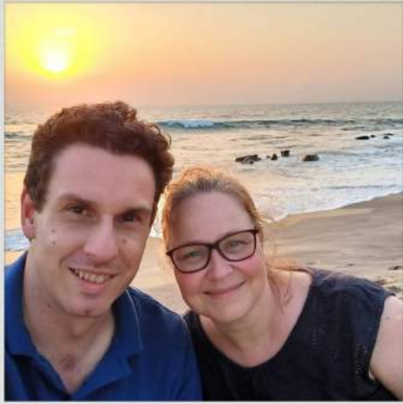
Genieten van een mooie zonsondergang