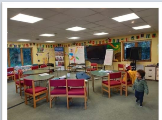
Het klaslokaal waar we dagelijks les hebben van 09.25 tot 13.00.

Na een intensieve introductie week zijn we begonnen met de eerste module van de En Route training, Understanding myself in mission. Over de komende weken zullen we 5 modules behandelen, waaronder