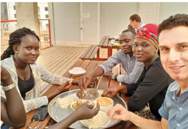
Nog een laatste keer lunchen met de collega's van Zuid-Soedan