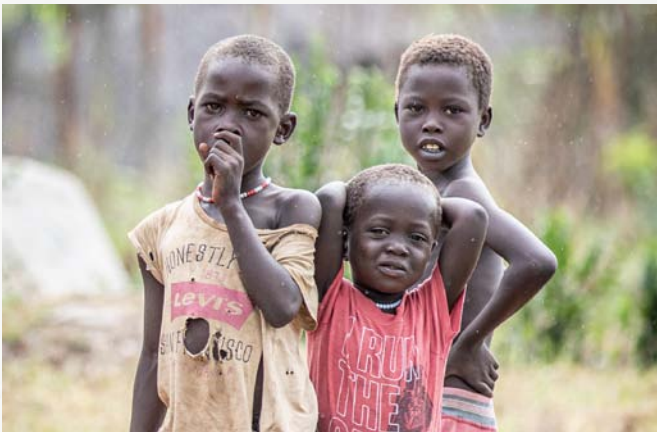
Vrede voor de volgende generatie.

Vrede is niet direct een woord dat ik associeer met Zuid-Soedan. Naast de internationale ruzies die gaan over olie en water (de Nijl stroomt dwars door Zuid-Soedan) gaat het binnen het land mis tussen de vele stammen. Koeien zijn ongelooflijk belangrijk in veel stamculturen. Stammen gaan dan ook op 'bezoek' bij elkaar om vee te stelen. Dit gaat gepaard met het verkrachten van vrouwen, in brand steken van huizen en vermoorden van mensen. Dit verschrikkelijke tafereel herhaalt zich keer op keer waardoor in sommige gebieden vrede een verre droom lijkt. Gelukkig zijn er organisaties die zich inzetten om gesprekken op gang te brengen tussen deze stammen en de negatieve spiraal te doorbreken. Ik mocht onderdeel zijn van een groot aantal vluchten tussen verschillende stammen en dorpjes waar deze gesprekken plaats vonden. Het is onzettend bemoedigend om te zien dat stamhoofden bereid zijn om concessies te doen en af te spreken om deze vreselijke praktijken te stoppen.