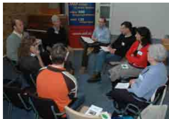
TFC Ontmoetingsdag 24 januari 2009