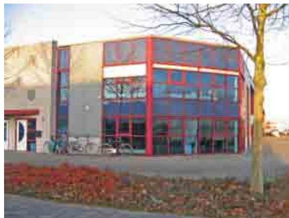
Nieuwe pand – van Leeuwenhoekstraat

Omdat MAF Nederland met de groei in personeel te krap kwamen te zitten, vond eind november een verhuizing plaats naar een nieuwe locatie aan de Van Leeuwenhoekstraat 20-1 te Harderwijk.