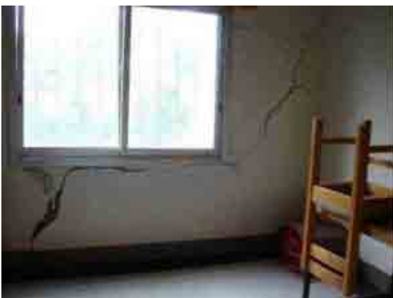
Oude woning op MAF compound Tsjaad

De kosten bedroegen ongeveer € 160.000,-, waarvan MAF Nederland € 55.000,- bijdroeg. € 10.000 hiervan kwam uit de ondernemersreizen. Het resterende bedrag kwam van MAF UK.