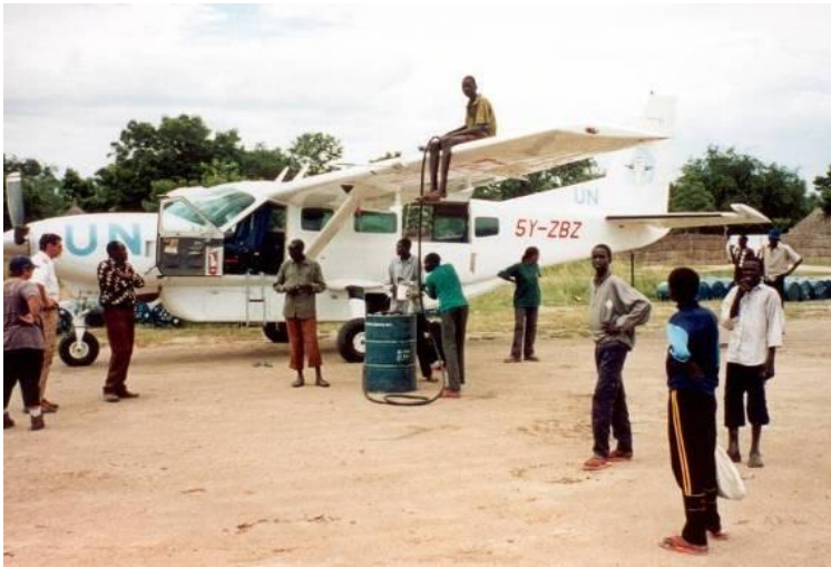
Vlucht naar Soedan

Via een bedrijf werd een gift van € 5.000,- ontvangen voor het ondersteunen van een conferentie voor kerkleiders in het binnenland van Suriname. Deze conferentie wordt jaarlijks gehouden en MAF Suriname verzorgt de vluchten vanuit diverse plaatsen in het binnenland naar de plaats van de conferentie en weer terug.