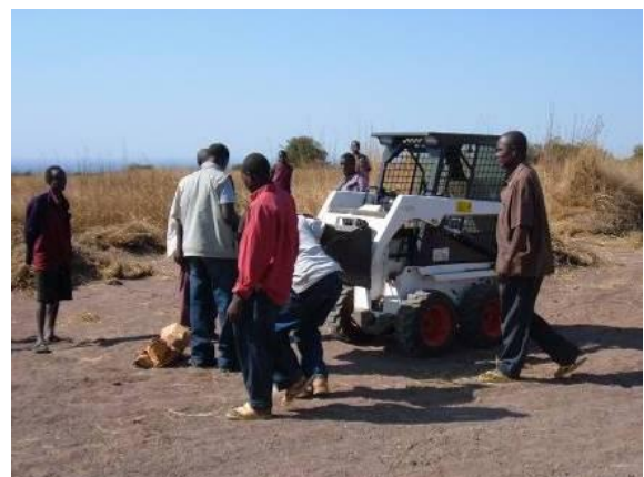
Bobcat in gebruik om vliegstrip aan te leggen

Er bleek bij Wilde Ganzen nog een klein bedrag over te zijn van een actie voor een nieuwe vliegstrip in Madagascar. Dit was welkom, omdat er nog een tekort stond voor dit project. Daarnaast gaf een particulier een gift voor nieuwe vliegstrips in Tanzania. Hier worden in vijf afgelegen gebieden vliegstrips gebouwd of heropend, om met name medische zorg mogelijk te maken. Elf strips werden in gebruik genomen, negen anderen zitten nog in het administratieve voorbereidingsproces. De Nederlandse bijdrage werd gebruikt bij de aanschaf van een bobcat, die bij de aanleg van diverse strips wordt gebruikt.