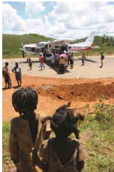
Maralambo - Madagaskar

Plaats van vestiging: Harderwijk, Van Leeuwenhoekstraat 20-1