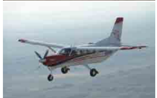
van boven naar beneden: GA8 Airvan Cessna 208 Caravan Quest Kodiak