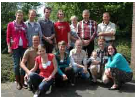
Kandidatendag 28 juni 2009

Daarnaast werd ook voor leden van de Thuisfrontcommissies in november een dag georganiseerd, waarbij onderling veel ervaringen werden uitgewisseld. Het ene jaar wordt door MAF Nederland een dag georganiseerd voor Thuisfrontcommissies, het andere jaar voor ouders van Internationale Stafleden.