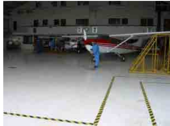
Laag modder op de hangarvloer makkelijk te verwijderen dankzij nieuwe verf