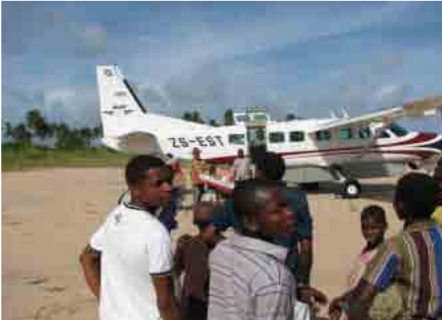
Mozambique shuttle vanuit Zuid-Afrika